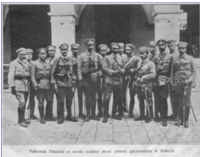
Pułkownik Piłsudski ze swoim sztabem przed pałacem gubernialnym w Kielcach.

Pułkownik Józef Piłsudski ze swoim sztabem przed Pałacem Gubernialnym w Kielcach w 1914 r.