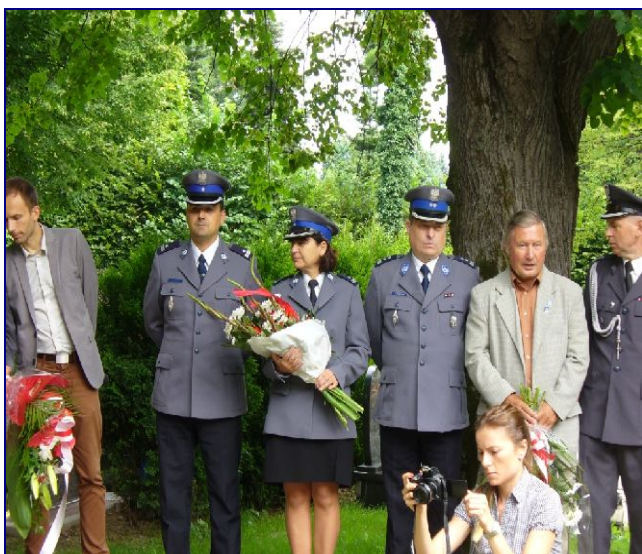
Delegacja komendy Miejskiej Policji w Jeleniej Górze pod przewodnictwem mł. insp. Piotra Wałczyka Zastępcy Komendanta Miejskiego Policji w Jeleniej Górze.