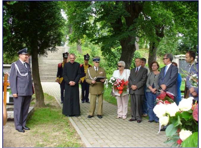
Wiązanekę kwiatów składa posłanka na Sejm RP Zofia Czernow.