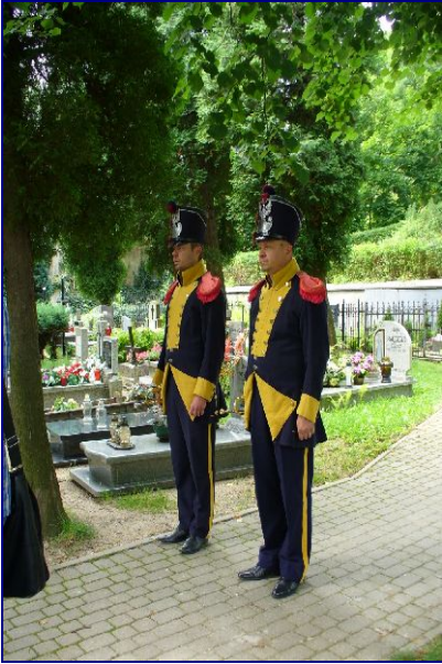
Sygnaliści w strojach z okresu powstania listopadowego.